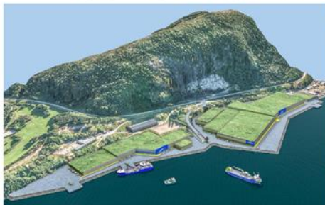
Bærekraftig Oppdrett og Investering på 3 milliarder i Sunnfjord

Stortingsbenken frå Sogn og Fjordane ser prosjektet, «Havliljen», som viktig for utviklinga av næringa og sysselsetjinga på kysten. Det er stort behov for å utvikle og legge til rette for nye attraktive arbeidsplassar. Nekst AS sitt prosjekt er svært kjærkome, men treng eit større omfang for å kunne bli realisert. Vi oppmodar difor fiskeridepartementet om å gje fleire konsesjonar til NEKST AS, og dermed legge til rette for gode løysingar og sikre at prosjektet «Havliljen» kan realiserast.